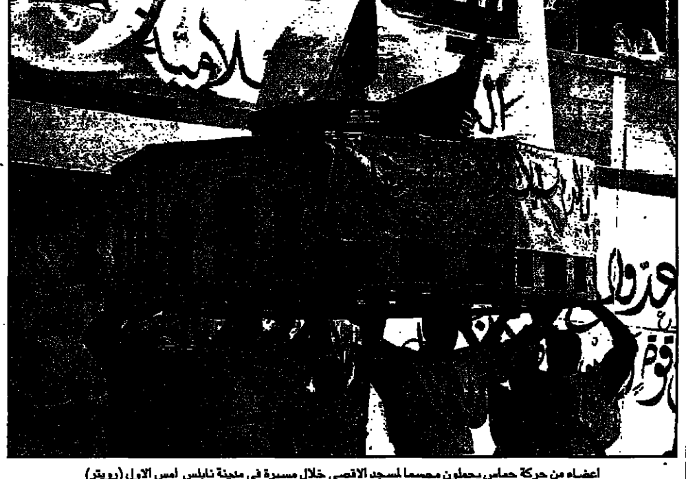
اعضاء من حركة حماس يحملون جثماناً لعضو الاسرى خلال مسيرة في مدينة نابلس امس الاول (ديار)

■ القدس - اف بى - اذنت صحيفة (هآرتس) الاسرائيلية امس الاحد ان الوسيط الامريكاني نينسون روس نصح عرفات بعدم الرهان على سقوط حكومة نتنياهو الاسرائيلية.